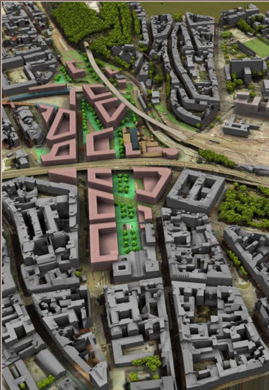
Transformační území Masarykovo nádraží - Florenc

celková urbanistická koncepce - Ing.arch. František Novotný, atelier FNA