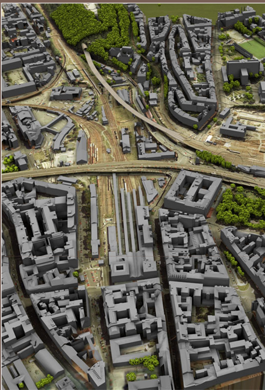
Transformační území Masarykovo nádraží - Florenc