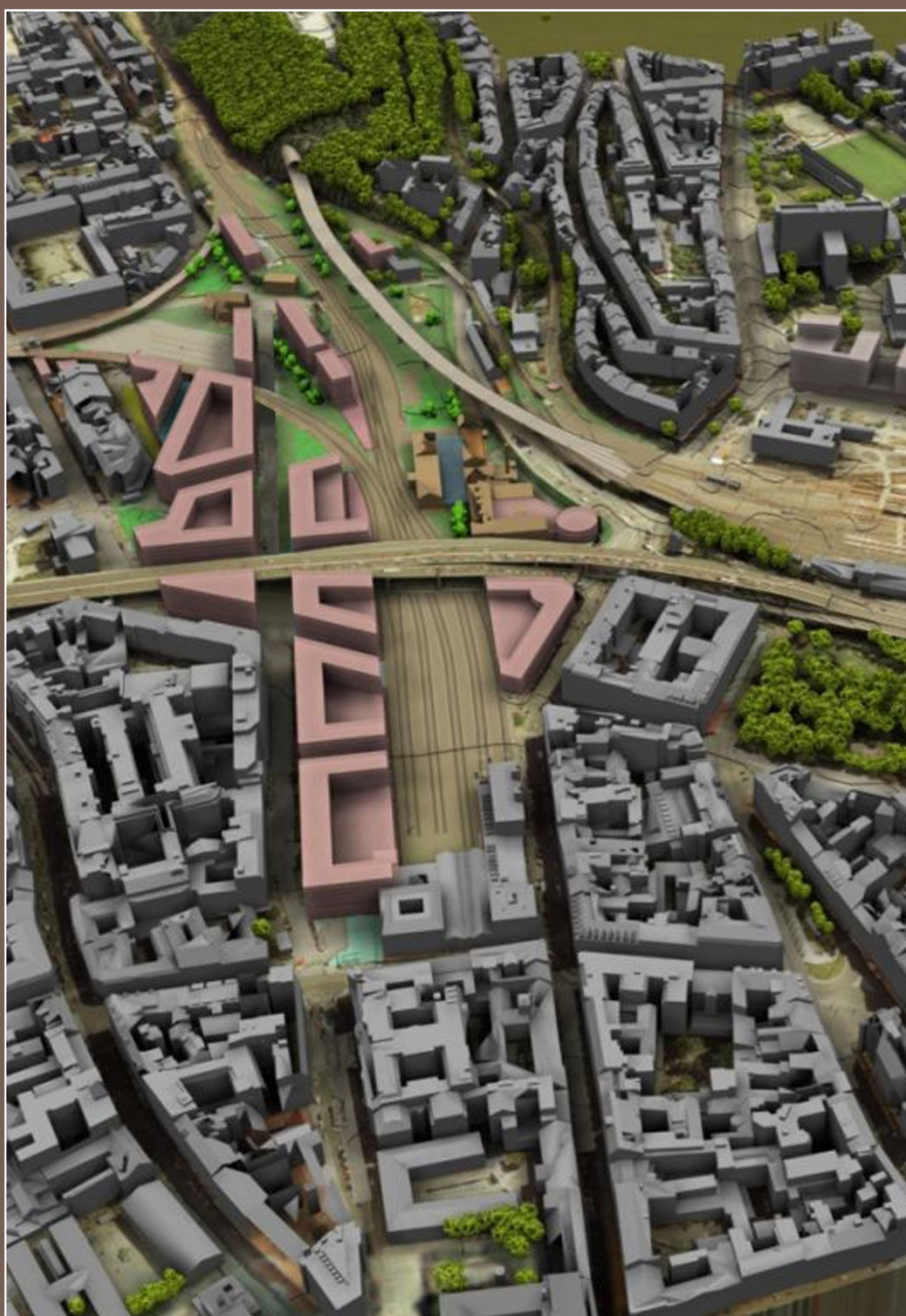
Transformační území Masarykovo nádraží - Florenc