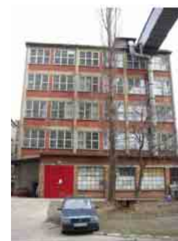
Vlárské strojírny foto © 2010