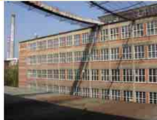
Svit Zln foto 6320