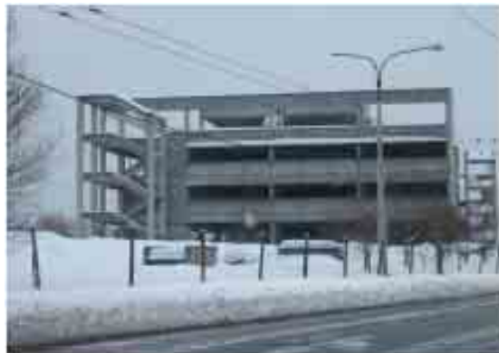
Skalce Jihle Svatky foto 6286