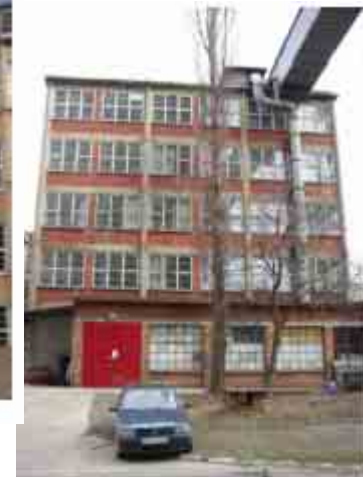
Svit Zln foto 6920