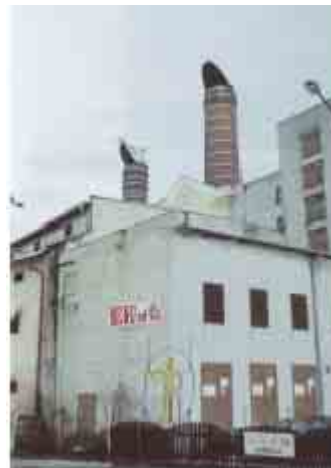
Pivovar Jaroslav foto 6511