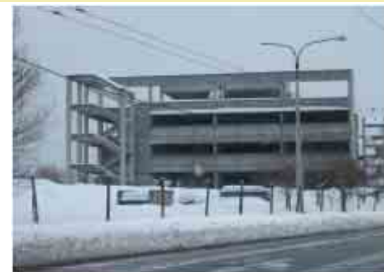
Skelet Jižní svahy foto © 2010