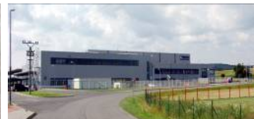
ERDRICH Umformtechnik s.r.o.