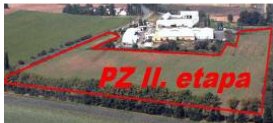
Volná plocha 17 ha