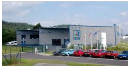
RAME CZ s.r.o.