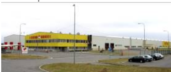
IVG Colbachini CZ s.r.o