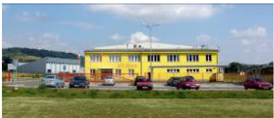
S.T.I. CZ s.r.o