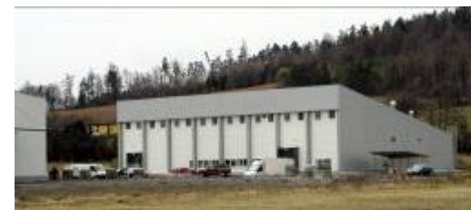
Maso V+W, s.r.o.