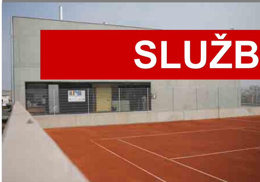
RS Sport Centrum Romana Šebrleho